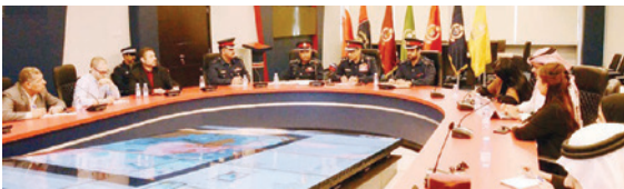
كتب اسلام مخلوف: أكد اللواء ركن بحري عمارة علالته سيادي قائد خفر السواحل أن مياه مملكة البحرين موطئة تهدتات أمنية خطيرة تشكلت منها التهريب والتعاطف مع المتهربين مؤكداً أن المخالفات التي ترتكبها أرباب صيد ساهموا بمرتكبيها في تهريب المخدرات والمواد المخدرة واستغلالهم في تهريب الأسلحة والذخائر التي تعطل دوريات خفر السواحل التي تعمل على إنفاذ القانون في المياه الإقليمية للبحرين. مؤكداً أن هؤلاء المتهربين يستخدمون قوارب الصيد لإشغال الدوريات وتمنعها من التعرف على الهدف غير المعرف. مؤكداً أن هؤلاء المتهربين يستخدمون قوارب الصيد لإشغال الدوريات وتمنعها من التعرف على الهدف غير المعرف.

« اللواء سيادي : المهربون يستخدمون قوارب الصيد لإشغال الدوريات ويؤكد: سن تعامل مع الهدف غير المعرف على أنه عدائي ضمن إجراءات إنفاذ القانون